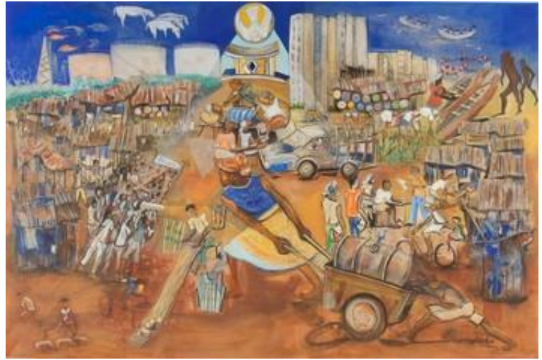
Hungertuch 2011 von Sokey A. Eдорh, einem zeitgenössischen Künstler Westafrikas

Liebe Aroserrinnen und Arosrer, liebe Feriengäste aus nah und fern